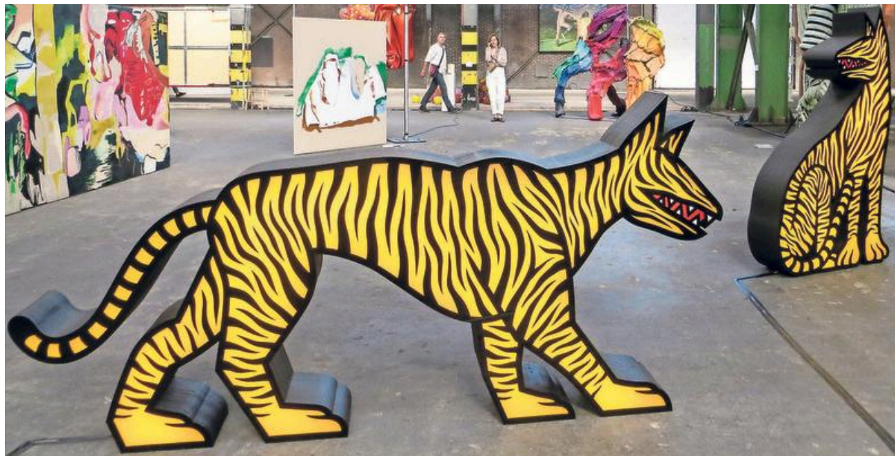
Big Art in 2019: een enorm gebouw vol grote kunst.

Met de vijfde editie keert ze terug naar de Projectfabriek op het Hembrugterrein. Op het voormalige defensieterrein in Zaandam werden circa een eeuw lang wapens en munitie geproduceerd. „Eigenlijk is Big Art elk jaar op een andere locatie, maar het Hembrugterrein is zo goed bevallen. Er kwa-