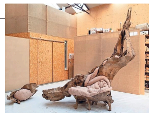
Het Big Art-werk in Korstanjes atelier.